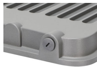
Válvula de presión y ventilación