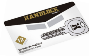
TARJETA DE REGISTRO