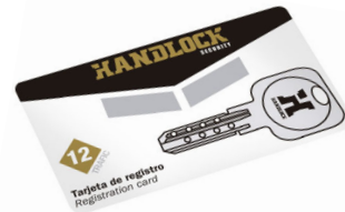
TARJETA DE REGISTRO