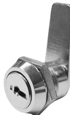
RECTA EQUIVALENCIA C111C IFAM