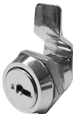
CURVA EQUIVALENCIA C111A IFAM