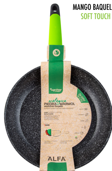
MANGO BAQUELITA SOFT TOUCH