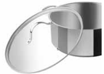
BORDE ACERO INOXIDABLE